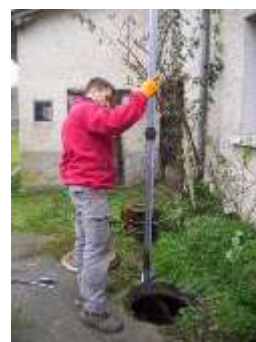
Mesure de boues d'une fosse septique

Vous recevrez prochainement un avis de passage vous proposant un jour et une heure de rendez-vous.